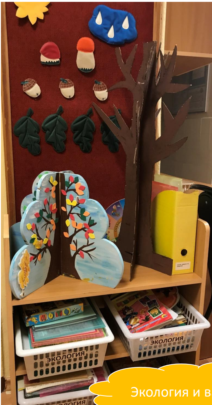
Экология и валеология